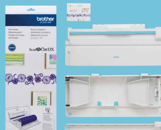
Alimentador de rollo CADXRF2