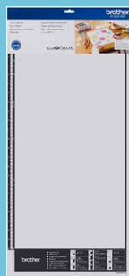
Tapete para Escaneo de 12"x24" CADXMATS24