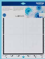
Tapete de baja adhesión 12"x12" CADMATLOW12