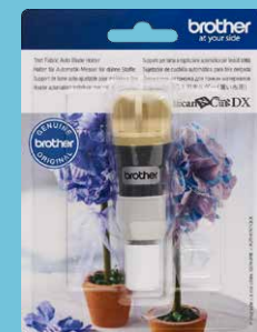
Sujetador de cuchilla automática para tela delgada CADXHLDQ1