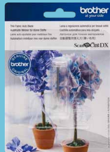
Cuchilla automática para tela delgada CADXBLDQ1