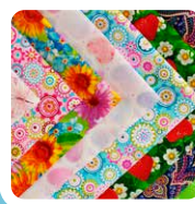
Tela de algodón Americano