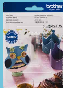
Cuchilla automática CADXBLD1