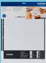
Tapete para escaneo de 12"x12" CADXMATS12