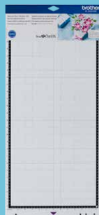
Tapete adhesivo estándar 12"x24" CADXMATSTD24