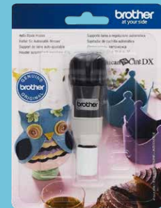
Sujetador de cuchilla automática CADXHLD1