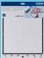
Tapete adhesivo estándar 12"x12" CADXMATSTD12