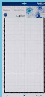
Tapete de baja adhesión 12"x24" CADXMATLOW24